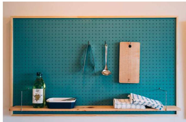
<with HANDS イメージ>