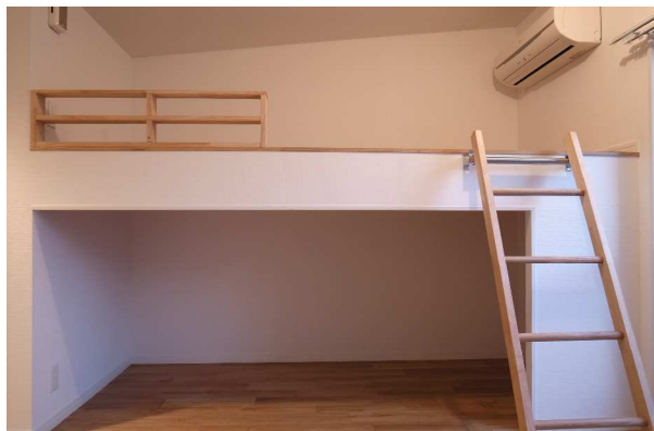
<ロフト造作プラン>