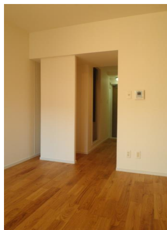
無垢フローリング(山栗)を使用