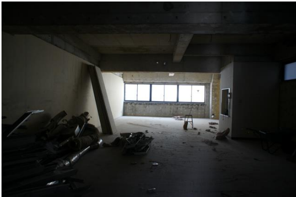
スケルトン状態になったオフィスビル